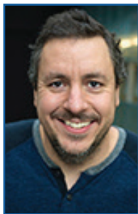
JAUME GOMIS Perimeter Institute for Theoretical Physics

For his broad range of important contributions to string theory and strongly coupled gauge theories, including the pioneering use of non-local observables, the exact computation of physical quantities in quantum field theory, and the unravelling of the nonperturbative dynamics of gauge theories.